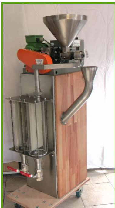
Gesamtaufbau der Mühle