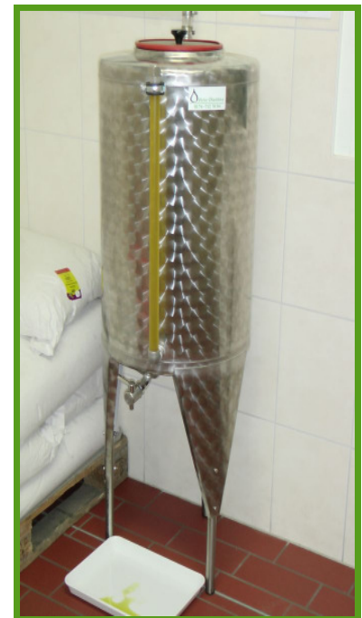
100 l Abfüllbehälter mit Füllstandsanzeige

Dieses gesamte Maschinen - Paket erhalten Sie bei uns für Netto 18.000,00 €