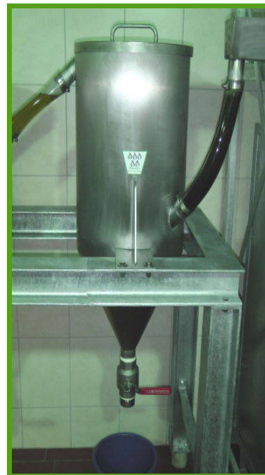
4 x 60 l Sedimentation in Edelstahl