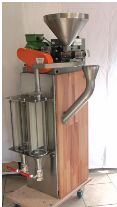
Olejarnia w całości