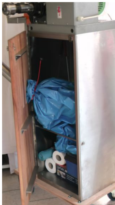
Dodatki i worek na pelety w szafce