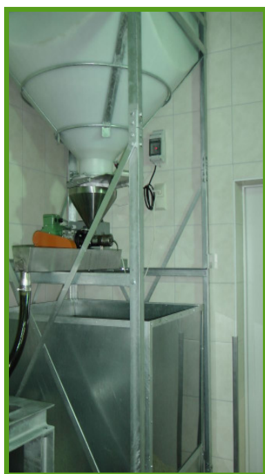
Prasa oleju z 500 l pojemnikiem na nasiona