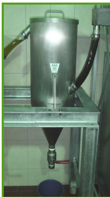
4 x 60 l sedymentacji w stali szlachetnej