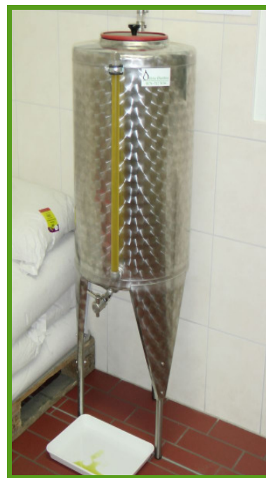
100 l pojemnik do napełniania z wskaźnikiem