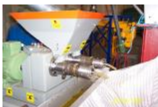
Presse à huile