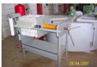
Filter-press à chambres avec filtre de sécurité et pompe à huile ainsi que système citerne de 2 500 l et pistolet. Le moulin complet recouvre env. 6 x 8 m au sol et env. 5 m en hauteur

Nous vous proposons cet ensemble de machines pour 46.000 euros H.T.