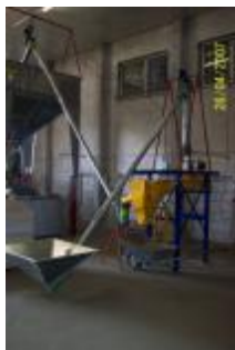
Réception colza Nettoyage Séparateur magnétique 2 vis convoyeuses.....

Un moulin produisant chaque année env. 100 000 litres d'huile destinée à la transformation en carburant comprend :