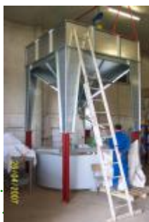
Silo tampon Distribution du colza Rés. d'huile trouble avec malaxeur